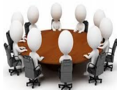
Комиссия при Министерстве здравоохранения РК