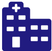
Врачебно-консультативная комиссия (ВКК) при поликлинике