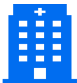
Выбор зарубежной МО, согласованной с пациентом

ИТОГО: Направление граждан РК на лечение за рубеж занимает до 37 рабочих дней