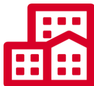
Профильная научно-исследовательская организация (НИИ) (11)