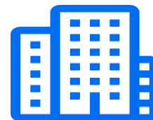
Рабочий орган (РО) при АО «Нац. научный центр материнства и детства»